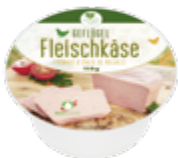
Geflügel Fleischkäse Bio Suisse Knospe