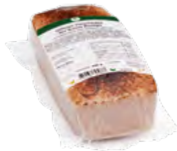
Geflügel Fleischkäse Bio Suisse Knospe