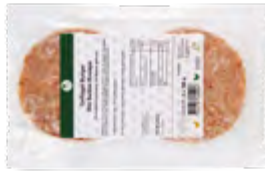
Geflügel Burger Bio Suisse Knospe TK